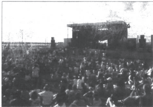
Thousands of people attended the opening weekend of the Shediac Lobster Festival.

During the past 50 years, the Shediac Lobster Festival has seen